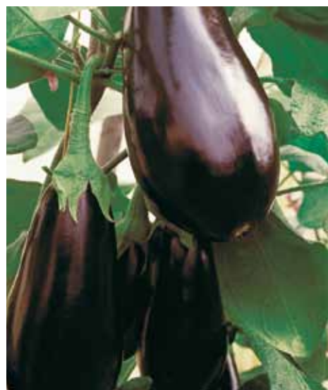
Black Pearl F1

Kompaktní rostliny nesou polodlouhé oválné plody velmi tmavě fialové až černé barvy. Vysoká kvalita i výnos. Určena pro jarní a letní pěstování ve sklenících. Středně raná.