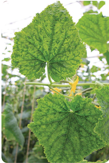
Вирус зеленой крапчатой мозаики огурца