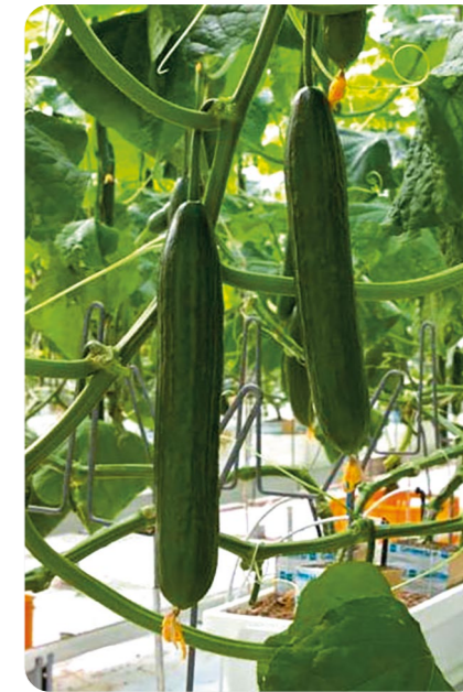
Ди Велоп F1