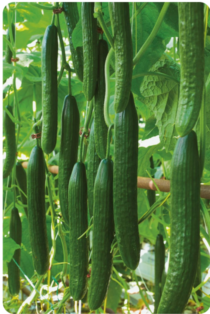
Ди Лайт F1